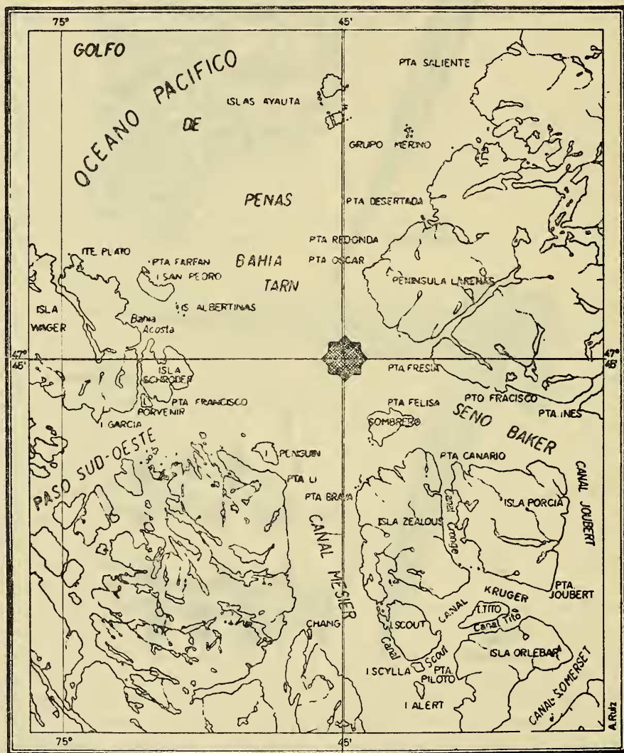
PLANO TOMADO DE CARTA PRELIMINAR ESC 1 250000 Nº 4775 GOLFO DE PENAS I.G.M. 1952

abundantes en el marco bucal (Fig. 8). Los pedicelarios de mandíbulas curvas son generalmente grandes, y pueden subdividirse en tres tipos: de mandíbulas iguales, que se hacen más angostas hacia la extremidad (Fig. 7-1); de mandíbulas iguales que se ensanchan hacia la extremidad (Fig. 7-2); y de mandíbulas desiguales, en que una sobrepasa a la otra en no más de 1/8 a 1/10 de su longitud, incurvándose en el extremo sobre la mandíbula más corta (Fig. 6).